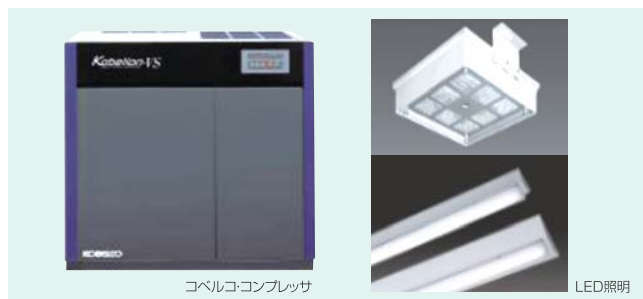
コベルココンプレッサ