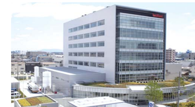
岩谷産業 中央研究所

環境に配慮しながら進歩することが、21世紀の企業に求められている姿勢です。私たちは、産業廃棄物処理装置をはじめ、トータルな公害防止と環境保全システムの実現に向けて、社会に貢献できる商品群を取り揃え、エコビジネスの明日を考えています。