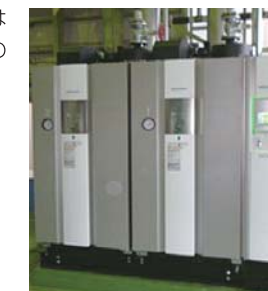
ボイラーMIURA(三浦工業)

有害物質の無害化、ごみの縮小、殺菌や害虫駆除が可能な焼却炉は、ますます需要が高まる一方、焼却物の多様化により、その燃焼と廃ガス処理には高い技術が求められるようになってきました。